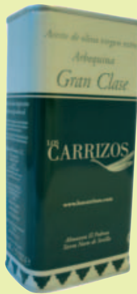
Aceite Los Carrizos

Farga - D.O Baix Ebre. Color amarillo verdoso de aspecto opalescente. En nariz recuerdos a nuez verde y frutos secos. Notas de almendra cruda y manzana Grand Smith. De intensidad muy buena. En boca resulta muy afrutado y retornan aromas muy marcados de manzana, posee un amargor final muy bien integrado. Marida muy bien con una ensalada de cigalas con granadas y manzana verde.