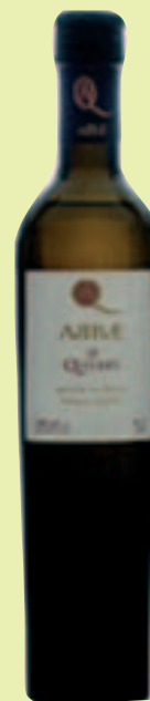
Aceite Hacienda Queiles

Arbequina. Color verdoso un poco nubado. En nariz finos aromas que recuerdan a tomate y almendra cruda y manzana reineta. En boca es suave maduro y elegante, equilibrado y afrutado. Tiene un paso sedoso y muy buena untuosidad y de excelente sazón frutal. Marida con un lomito de merluza hervida de Celeiro.