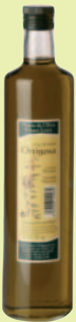
Aceite Hacienda Ortigosa

Arbequina. Color amarillo dorado de aspecto brillante. En nariz nítidas notas de frutos secos y hojas secas. Posee resonancias cítricas ( pomelo). En boca resulta muy elegante de presencia, muy equilibrado excelentemente conseguido y de retro-nasal elegante. Es denso y tiene cuerpo. Se encuentra en su punto óptimo de maduración. Marida muy bien con una una cecina de vaca.